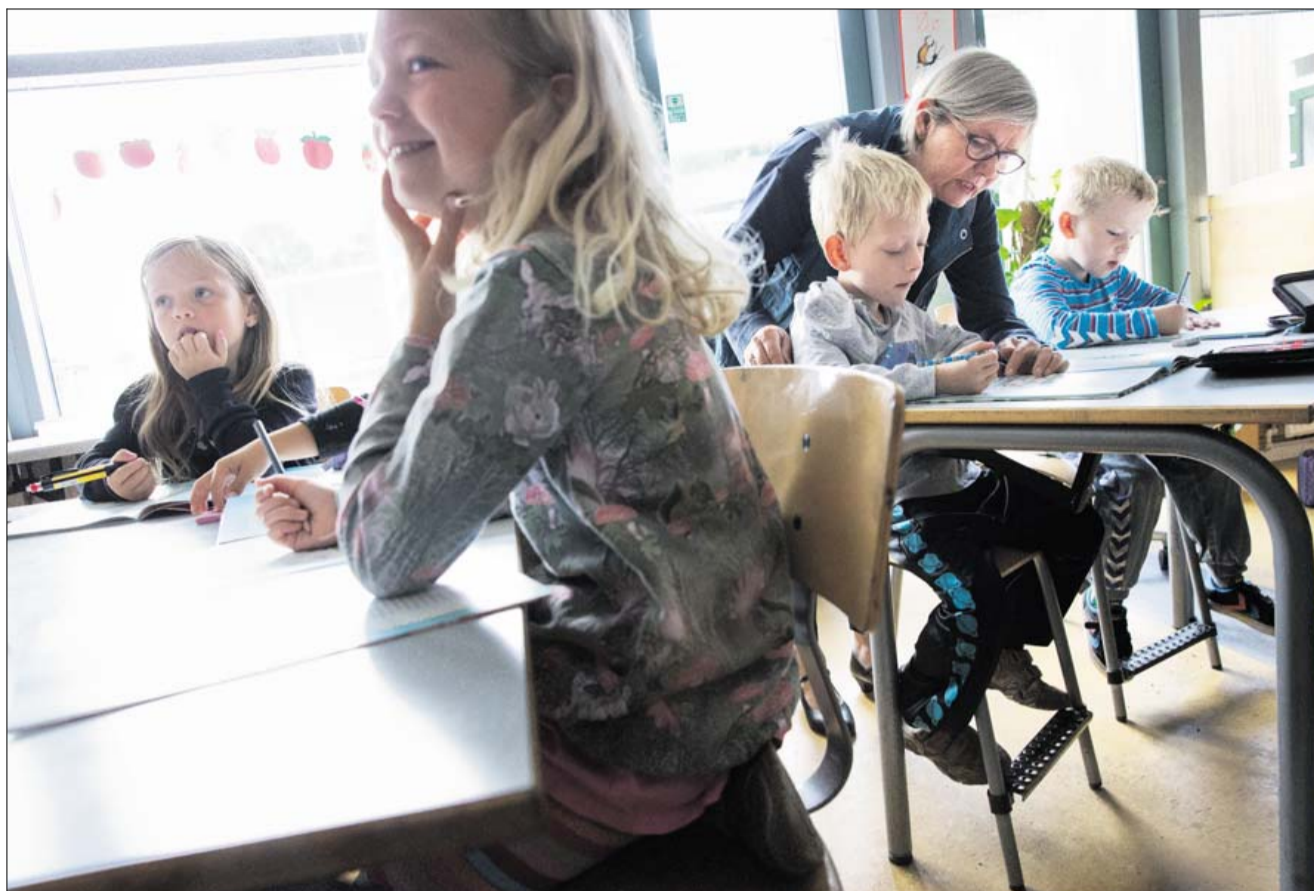
Det kniber med at få forældre til at arbejde som frivillige i skolerne. Til gengæld hjælper ældre gerne til. Billedet er fra Højvangskolen i Aarhus, som har tilknyttet såkaldte skoletanter og -onkler.